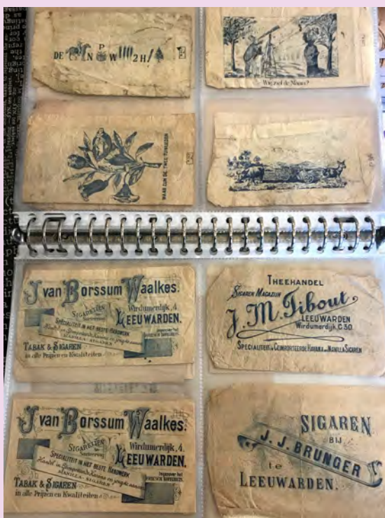
Ruil- en determinatiedag Leeuwarden op 14 april 2019. (pag. 71)