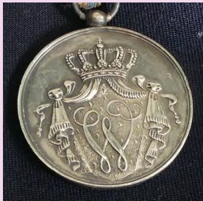
Een wedstrijdmedaille van de Rookclub 'De Moriaan'. Wie kan hier meer over vertellen? (pag. 56)